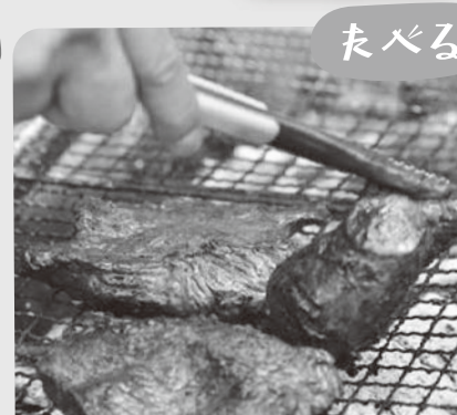
蔵求牛、カニちゃんこ鍋、打吹公園だんごなど美味しいもの盛りだくさんで食べて満足！！