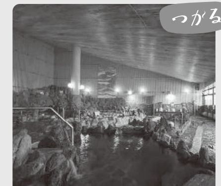
名湯百選の関金温泉は、そのあまりの美しさから「白金の湯」とも呼ばれています。