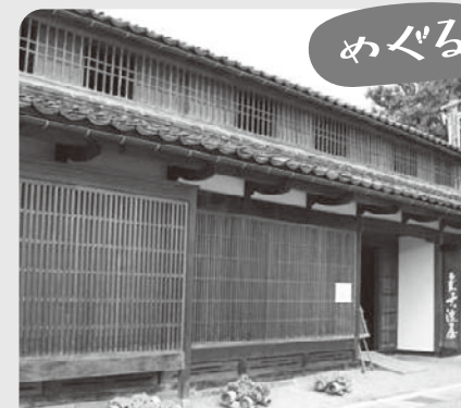
白壁土蔵群、赤瓦、倉吉淀屋、円形劇場など古きから新しき倉吉を巡って楽しむコース！