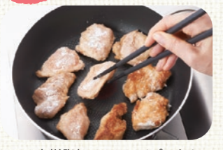
フッ素樹脂加工のフライパンならさらに少量の油分でOK

鶏 胸肉は、低脂肪で高たんぱく質な上、皮なしで調理すれば、さらに脂肪分を減らすことができます。 また、メタボにはご法度と思われるがちな「から揚げ」も、肉を薄く切り、フッ素樹脂加工のフライパンを使って少量の油で焼けば、通常のから揚げよりエネルギーダウンが可能です。 食材選び&調理法で賢くエネルギーコントロールをし、あらゆる生活習慣病の要因となる肥満を予防・改善しましょう。