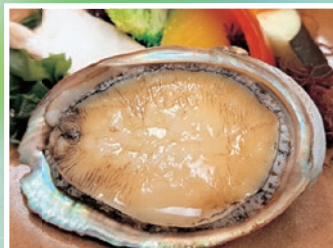
「活アワビの踊り焼き」80g～香草バターソース～ 「A5黒毛和牛ステーキ」60g～トリュフ塩～