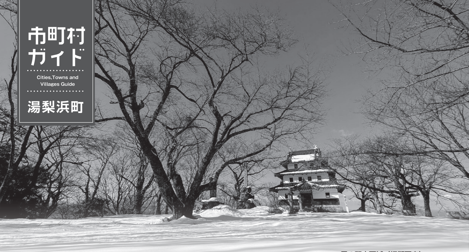
雪の羽衣石城（模擬天守）